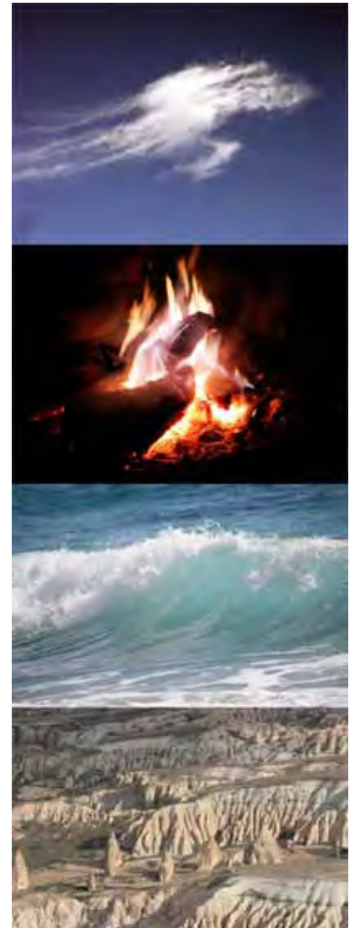
Die 4 Grundelemente als Teil des GODAI Systems

Die Kursteilnehmerinnen benötigen ihre eigenen Stöcke (Rattan 66cm lang, 2,6 cm Durchmesser) sowie ein Übungsmesser. Wer einen eigenen Langstock besitzt, bitte mitbringen (180cm lang, 3,0 – 3,5cm Durchmesser). Auch Schreibunterlagen nicht vergessen